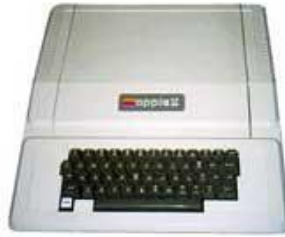
1977 Apple II