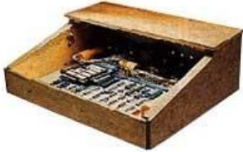
1976 Apple I

Apple - to doskonały przykład "działalności garażowej", która z czasem przekształciła się w międzynarodowe przedsiębiorstwo. Jak to możliwe? Dzięki innowacyjnemu produktowi oraz ... wsłuchiwaniu się w potrzeby klientów. Ci chcieli graficznego interfejsu (ikon zamiast napisów), prostej obsługi i ... ładnego wyglądu. Dostali to, choć produkt nie był tani a jego produkcja ograniczona.